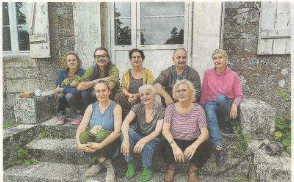
Une nouvelle expérience attend le public, dimanche, à 17 h, au domaine de Kerminy. Expérimenter un parcours immersif et inclusif.

Ce projet européen a été animé entre la France et l'Italie, via des ateliers internationaux. « On a évolué, dans différents territoires. On a travaillé en Italie, le lien avec la terre, en Bourgogne, le lien avec l'eau. Et aujourd'hui, on est à Kerminy. On va mettre l'accent sur l'appel de la forêt